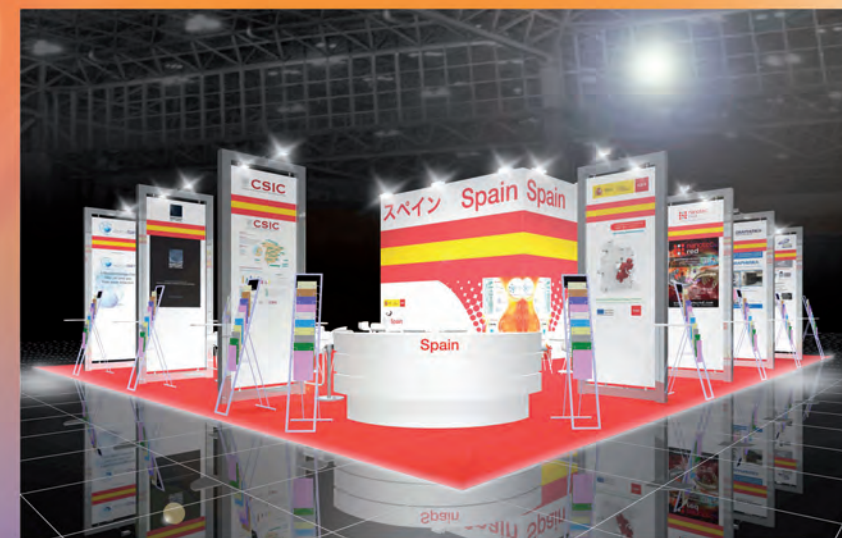
スペイン エリア 2012年2月15日-17日 東京ビッグサイト